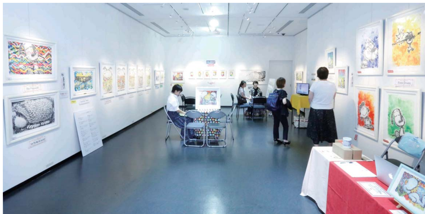
*画像・イラスト等の保存・転載・無断利用はお断り致します*