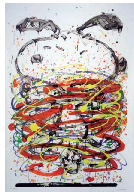
Red Little Fancy

現在エバハートは西海岸に拠点を移し、カリフォルニアの陽光を浴びながら、制作活動に励んでいます。自分の感情や美しい景色、ときには社会情勢からもインスピレーションを受け、そこに独自のセンスと技法が加えられ彼のアートは生まれるのです。世界で唯一「ピーナッツ」キャラクターを自由に描くことが出来るアーティスト トム・エバハートは、アートを通じ私達にメッセージを送り続けています。