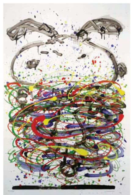
Blue Little Fancy