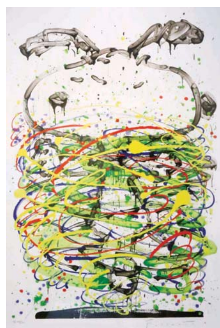
Green Little Fancy