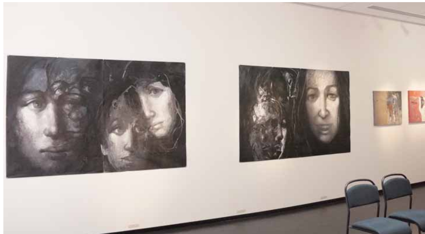
FACING YOU-1 FACING YOU-2